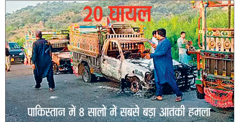
पाकिस्तान में 8 सालों में सबसे बड़ा आतंकी हमला