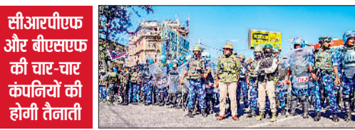
सीआरपीएफ और बीएसएफ की चार-चार कंपनियों की होगी तैनाती

केंद्र ने हाल ही में घोषणा की थी कि मणिपुर में सीएपीएफ की 50 नई कंपनियां तैनात की जाएंगी। पिछले सप्ताह पहाड़ी जिले